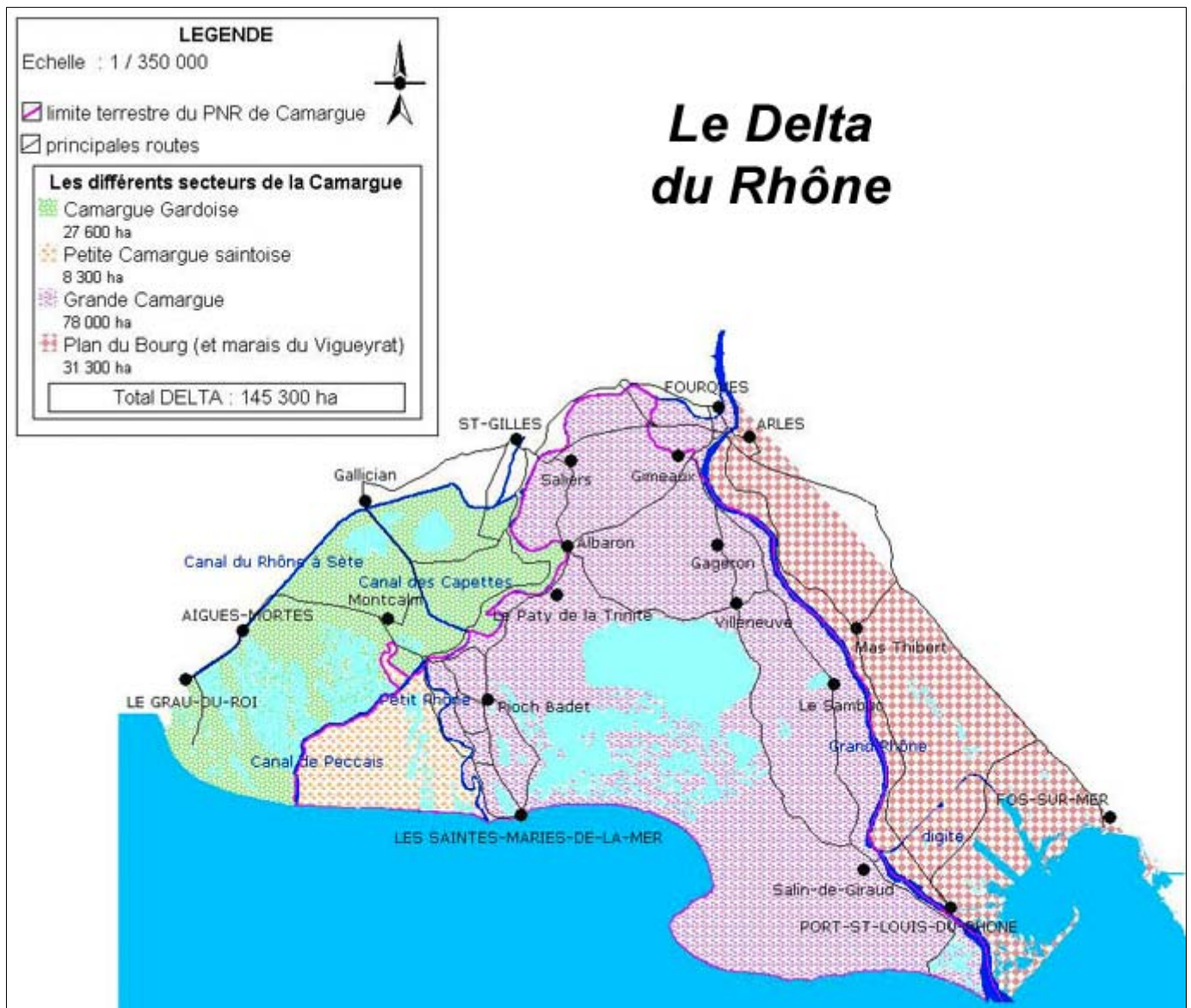
Figure 1. Localisation des différentes entités géographiques délimitées dans le Delta du Rhône. (Modifié à partir de PNRC, non daté). Pour des questions de commodités, la Petite Camargue Saintoise a été rattachée dans cette étude à la Grande Camargue (limites du PNRC).